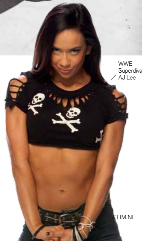
WWE Superdiva / AJ Lee